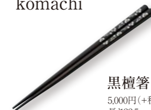
黒檀箸 5,000円(+税) 長さ22.5 黒檀、貝