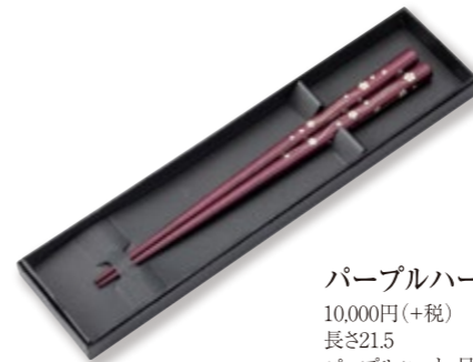
パープルハート箸 10,000円(+税) 長さ21.5 パープルハート、貝