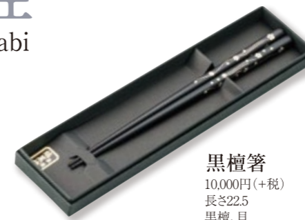
黒檀箸 10,000円(+税) 長さ22.5 黒檀、貝